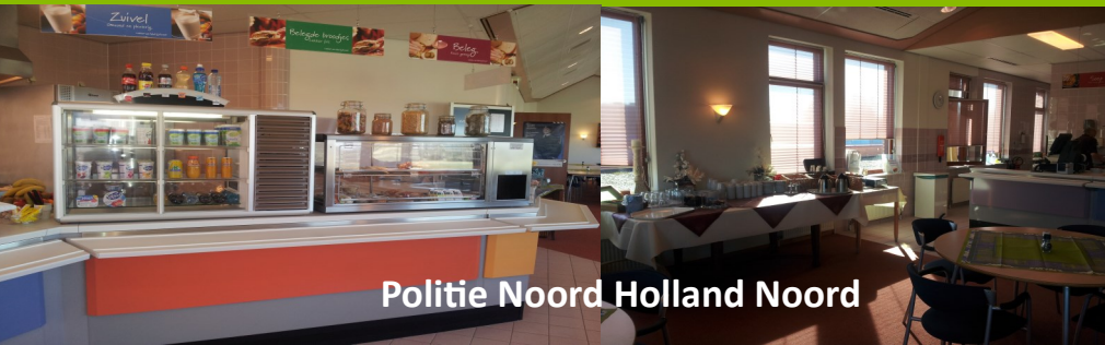
Politie Noord Holland Noord